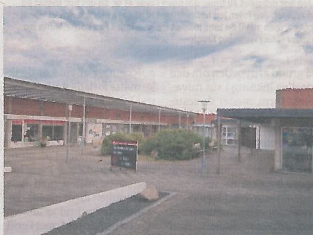
Det snart 50 år gamle Center Øst i Egå kan være væk om få år og erstattet af et nybyggeri, der kombinerer etageboliger, rækkehuse og butikker og andre erhvervslejemål.

Samlet løber nybyggeriet op i omkring 16.000 etagekvadratmeter, hvoraf to tredjedele er boliger.