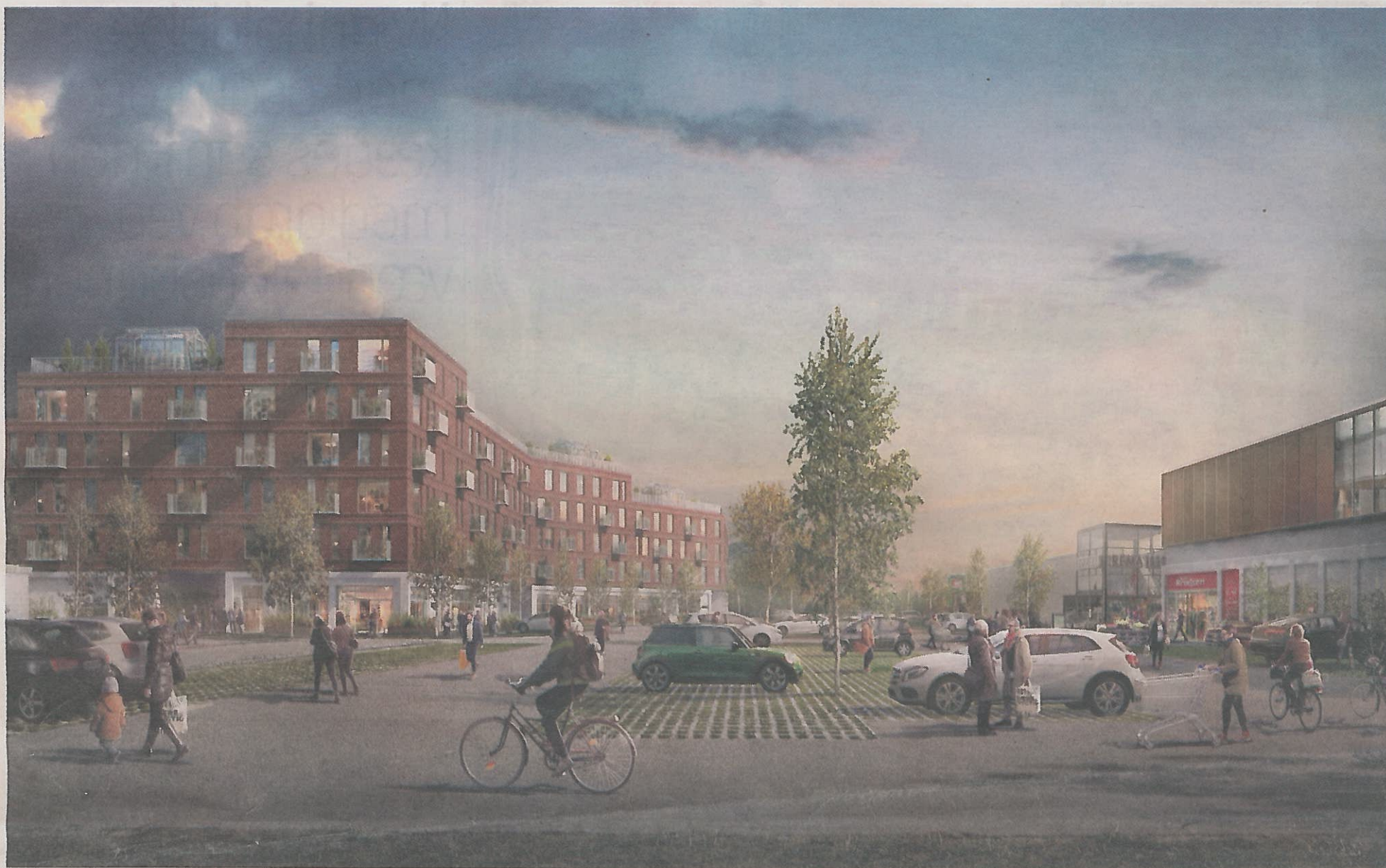
Sådan kan det komme til at tage sig ud, hvor Center Øst i Egå ligger i dag - med en karré med flere end 100 boliger foruden butikker til den ene side og et erhvervsbyggeri med SuperBrugsen i stueetagen på hjørnegrunden mod Grenåvej. Illustration: Årstiderne Arkitekterne